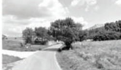
TRAVERSÉE D'ENTRÉE DE VILLAGE Insertion paysagère aux abords de la fontaine existante

«Valoriser et signaler progressivement l'entrée de ville dans une logique de campagne».