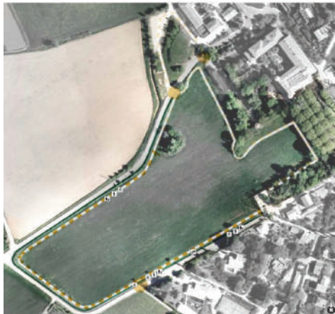
TOUR DE CHAMPS Section 5

Les travaux devraient commencer d'ici la fin de l'été.